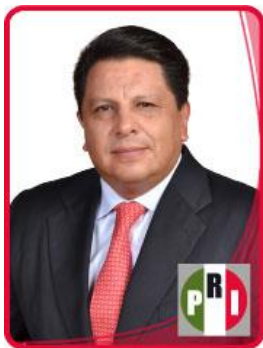
Dip. Enrique Mendoza Velázquez.

Toluca de Lerdo, Estado de México, a ____ de enero de 2014